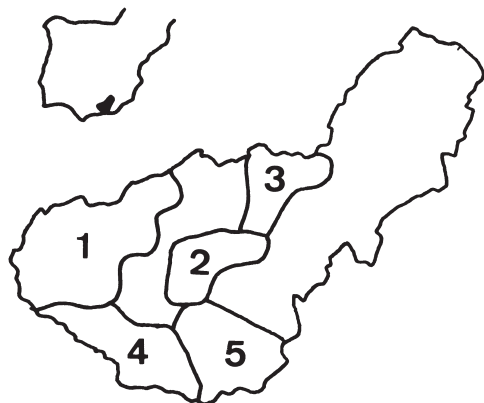
FIG. 1.—Localización del área de estudio y comarcas consideradas. 1: Sierras Subbéticas; 2: Sierra Harana; 3: Depresión de Guadix; 4: Sierras de Almirajara, Lújar y Tejada; 5: Alpujarra-Contraviesa. Véase el texto para más detalles.

La alimentación durante la temporada reproductiva se basó en el consumo del conejo y de la Perdiz Roja (Tabla 2). En general la dieta resultó similar en todas las comarcas consideradas (test de Friedman: \chi^2 = 0,657 , g.l. = 4, n.s.), exceptuando el caso de las Alpujarras-Contraviesa ( \chi^2 con cada uno del resto de las comarcas, P < 0,0001 , g.l. = 6 en todos los casos), donde las principales presas fueron las palomas y los pequeños mamíferos (Tabla 2). La alimentación fue constante en el tiempo (test de Friedman \chi^2 = 1,829 , g.l. = 4, n.s.; Fig. 1). Si bien se observó una tendencia temporal a la disminución del conejo (Fig. 1), ésta no fue significativa ( r_s = 0,859 , P = 0,062 , g.l. = 4).